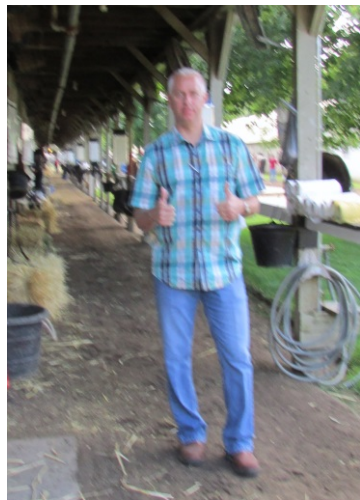
Todd A. Pletcher Racing Stables